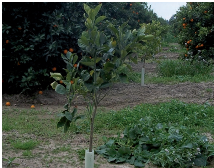
FruitWrap a Doppia parete